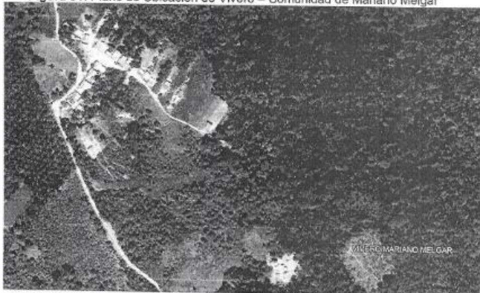
Figura 01: Plano de Ubicación de Vivero – Comunidad de Mariano Melgar